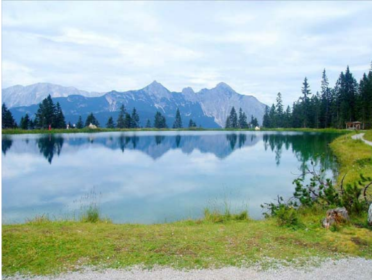
Foto: Paesaggio austriaco

La sera della vigilia di Natale ci fu un servizio meraviglioso e la chiesa era quasi piena. La musica era magnifica e lo spirito felice. Al termine, il pastore e sua moglie salutarono all'uscita ciascun intervenuto e molti dissero che sarebbero ritornati. Un uomo anziano, che abitava nelle vicinanze, era rimasto seduto nella panca a guardare fisso il muro di fronte... Il pastore gli chiese come mai non usciva.