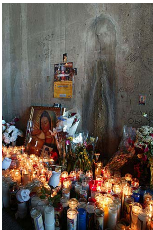
Foto: Una macchia di umidità comparsa in un tunnel viene scambiata per una apparizione della Madonna e scatena la superstizione popolare

L'uomo del passato poteva vivere una fede superstiziosa e ignorante, non migliore per molti aspetti di quella di oggi, ma sentiva di dipendere da un Dio al quale doveva rendere conto. L'uomo del nostro tempo sente, sempre di più, di dipendere da se stesso, di essere creatore e giudice della propria moralità.