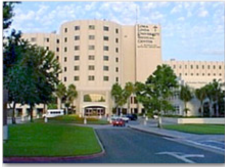
II College of Medical Evangelist