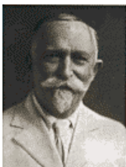
Dr. J. H. Kellogg