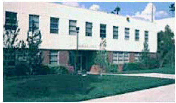
Grigg Hall, Università di Loma Linda