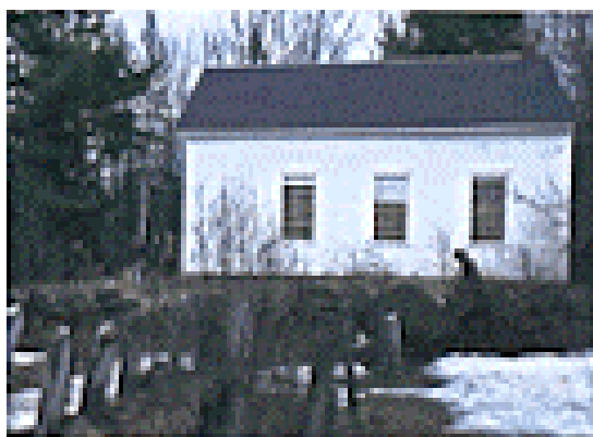
Prima congregazione, Washington, New Hampshire