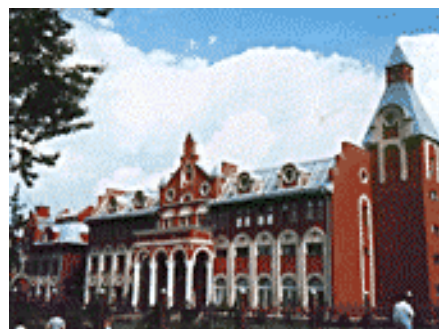
Zaoski Theological Seminary (Russia)