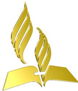
Nuovo Logo della Chiesa Avventista