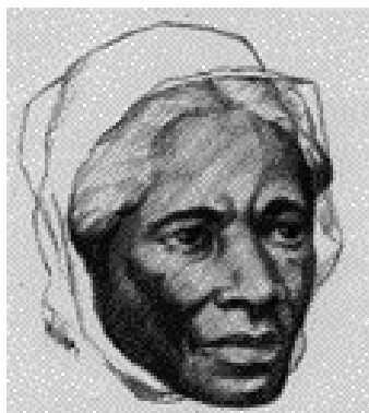
Sojourner Truth , famosa abolizionista, divenne avventista intorno al 1858