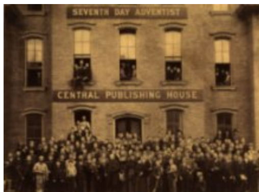
Casa Editrice Review and Herald a Battle Creek