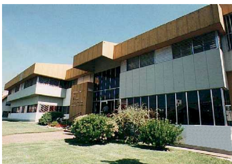
Casa Editrice Sudamericana, Buenos Aires (Argentina)