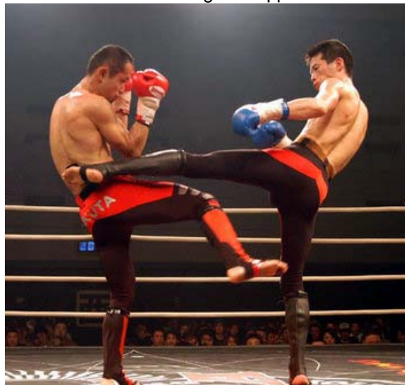
Foto: Combattimento di Shoot Boxing