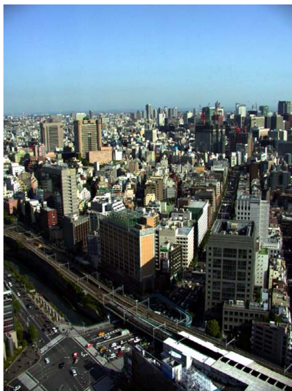
Foto: Vista di Tokyo

Lo stavano portando via quando... "Il prossimo!"... "Pensano che si sia rotto l'osso del collo e... sono io il prossimo?" Domandai di essere lasciato solo, poi mi inginocchiai: "Per favore, Padre - preghi - So che Tu molto probabilmente vuoi che io testimoni in un altro modo, ma questo è ciò che sto per fare. Così, per piacere, sii con me e aiutami, qualunque cosa io faccia. Spero che nessuno rimanga gravemente ferito, e specialmente io."