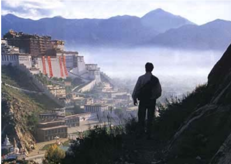
Foto: Portola Palace - Lhasa, Tibet

Gli potevano capitare due cose: o sarebbe stato cucito dentro una pelle di yak (bovino tibetano) bagnata e lasciato al calore del sole finché la pelle, una volta asciugata e ristretta, non lo avesse stritolato e fatto morire; oppure sarebbe stato gettato in un profondo pozzo senz'acqua, su un mucchio di cadaveri di condannati precedenti, e lasciato lì a morire di fame.