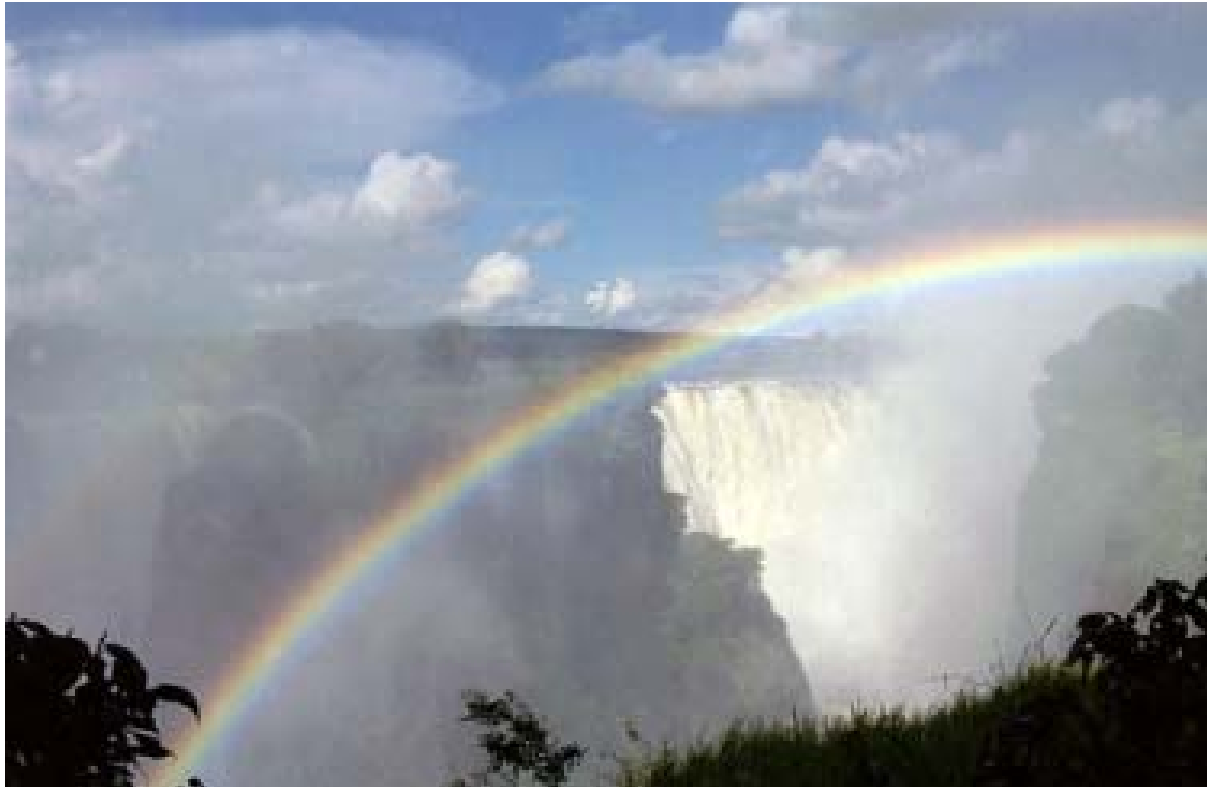
Foto: Cascate in Botswana