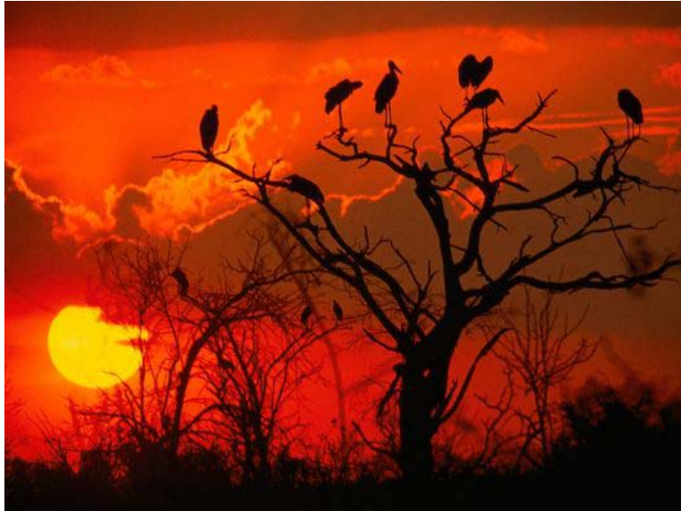
Foto: Tramonto del Botswana

La "kaross" che portava sulle spalle era scivolata un po' giù e le frecce erano ben visibili. L'attonito Pastore studiò attentamente il suo visitatore e si rese conto che, di fronte a lui, non c'era un comune africano. Come tutti gli altri africani, anche lui nutriva una certa paura per i Boscimani, ad ogni buon conto – per cortesia – fece accomodare lo straniero in casa.