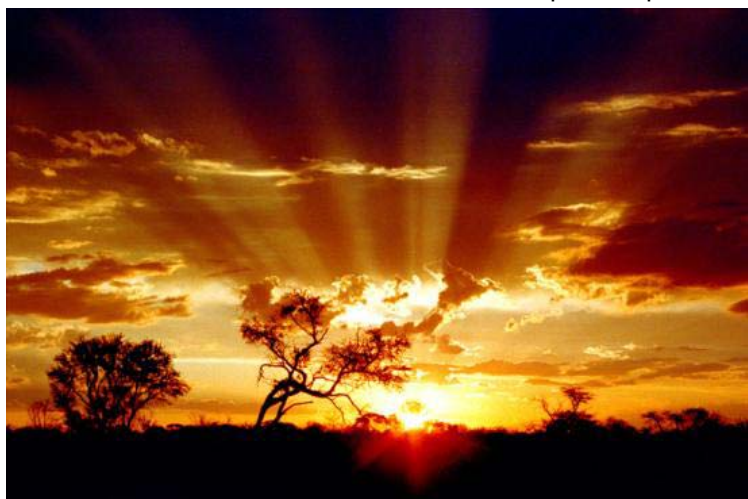
Tramonto nel Kalahari