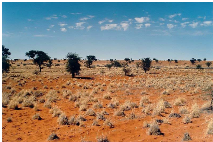
Foto: Il deserto del Kalahari

I Boscimani sono un popolo selvaggio, nomade, che – diverse generazioni prima – era fuggito all'avanzare della civilizzazione. Mangiavano la carne cruda degli animali che cacciavano e vestivano le loro pelli, cingendosene i fianchi. Mangiavano serpenti, ratti, insetti, radici – qualunque cosa avesse potuto tenerli in vita. Erano capaci di orientarsi nel deserto del Kalahari, dove non rimangono tracce da seguire... quel deserto che a volte appariva di un verde ingannevole, a causa dei suoi cespugli spinosi e degli alberi la cui linfa rappresentava una riserva d'acqua nel sottosuolo, fuori dalla