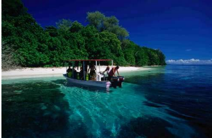
Foto: Scorcio delle Isole Salomone