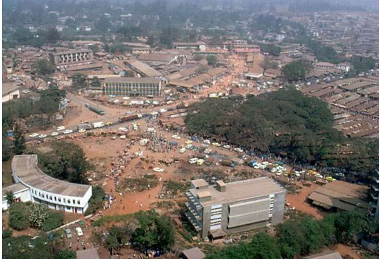
Foto: Ibadan, Nigeria