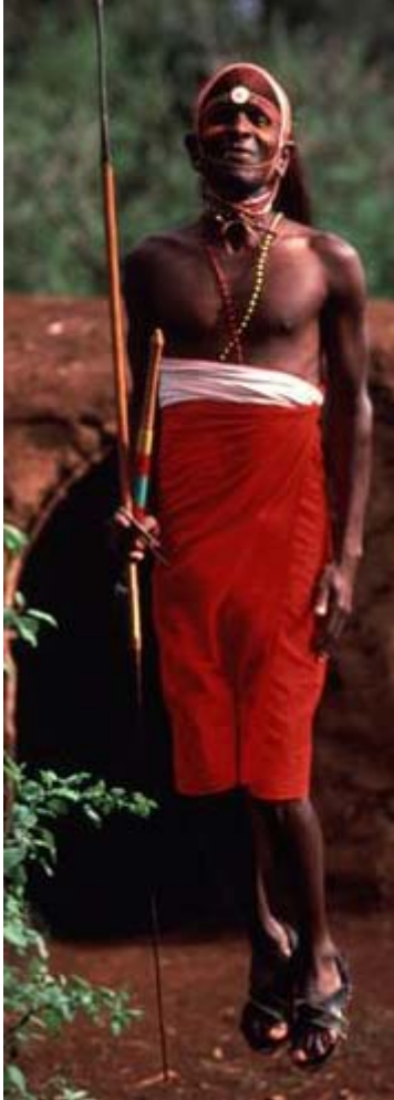
Foto: Guerriero Masai