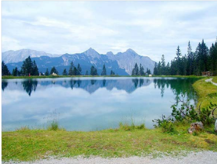
Foto: Paesaggio austriaco

La sera della vigilia di Natale ci fu un servizio meraviglioso e la chiesa era quasi piena. La musica era magnifica e lo spirito felice. Al termine, il pastore e sua moglie salutarono all'uscita ciascun intervenuto e molti dissero che sarebbero ritornati. Un uomo anziano, che abitava nelle vicinanze, era rimasto seduto nella panca a guardare fisso il muro di fronte... Il pastore gli chiese come mai non usciva.