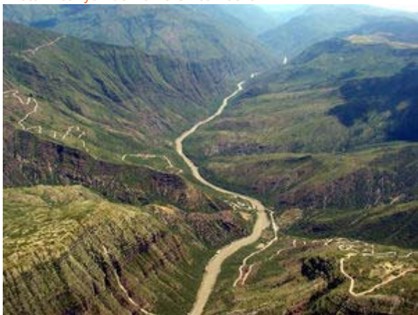
Foto: Il canyon del fiume Chicamocha

I capi religiosi sembravano aver avuto la premonizione che un grande risveglio spirituale si sarebbe presto verificato nella loro zona.