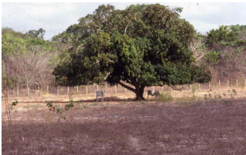
Foto: Un albero di mango

sole stava toccando le cime degli alberi di mango, a ovest della nostra istituzione. Mentre ci stavamo dirigendo verso il campo da gioco vicino all'edificio della scuola che serviva anche da chiesa, notai che il posto brulicava di gente come un formicaio.