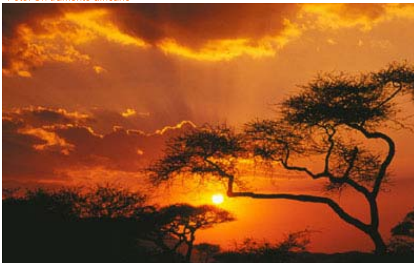
Foto: Un tramonto africano

“Due giorni! - risposi - Fratello, io non sapevo che sarei venuto qui fino alla notte scorsa, dopo che l'irace degli alberi cominciò il suo canto serale... Come potevate saperlo voi da due giorni?”