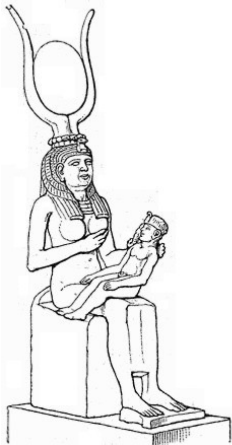
Foto: Iside e Horus