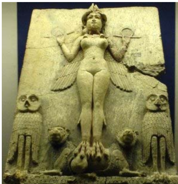
Foto: La dea Ishtar

«Il culto solare, si può dire, è all'origine di gran parte del ritualismo e della mitologia religiosa che in maniera naturale è rimasta "pratica" culturale in tante tradizioni dei culti dei santi e dei patroni locali. Queste pratiche rituali si ricollegano al mito di Tammuz. Questo mito è vecchio quanto la storia, esso risale, secondo la leggenda, al periodo post-diluviano. Si ritrova nell'epoca di Ghilgamesh...