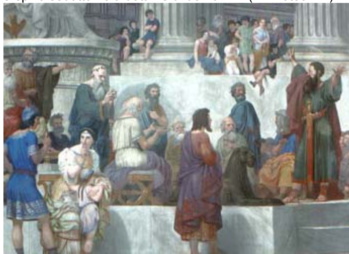
Foto: Paolo predica nell'areopago di Atene

“Ma lo Spirito dice espressamente che nei tempi a venire alcuni apostateranno dalla fede, dando retta a spiriti seduttori e a dottrine di demoni...” (I Timoteo 4:1).