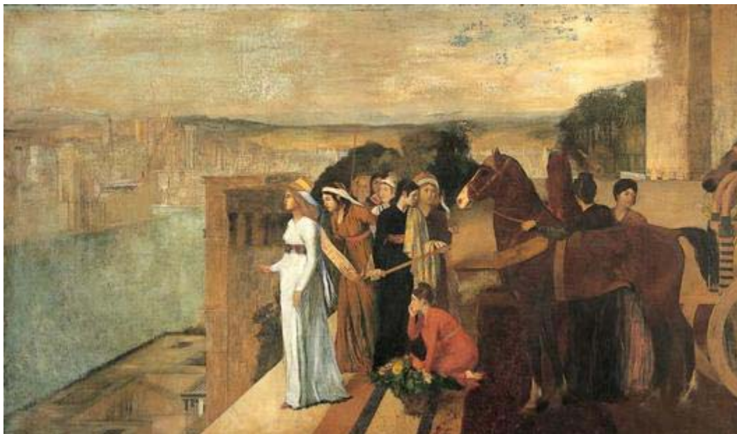
Foto: "Semiramide costruisce Babilonia" – Edgar Degas (1860-62) – Parigi, Museo d'Orsay

Satana sapeva che Gesù avrebbe lasciato il cielo per nascere da una vergine e diventare il Salvatore del mondo e il Mediatore tra Dio e l'uomo... Così egli progettò un piano malvagio per confondere le acque ed abituare gli uomini a stornare la propria adorazione dal vero Salvatore, il Creatore, alla madre, la creatura. Per questo motivo introdusse fin dagli albori della storia umana la figura di una vergine, dea madre, che propagò in tutte le culture antiche, facendo in modo che tale tradizione fosse molto forte, molto radicata nel cuore umano. In questa maniera, anche se non fu la sola, si preparò la via per riuscire a paganizzare il cristianesimo nascente.