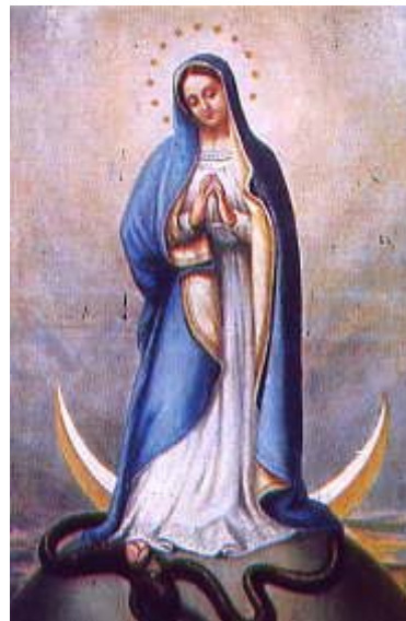
Foto: Nella raffigurazione di Maria, qui accanto, essa è vista calpestare il serpente, simbolo di Satana, cosa che la Bibbia insegna avrebbe fatto Gesù (Genesi 3:15)

Un'altra conseguenza di questa contaminazione del cristianesimo fu l'introduzione della domenica (giorno caro a tutta l'antichità pagana e dedicato al dio Sole nelle sue varie espressioni) insieme al suo corredo di rafforzamento e divinizzazione delle gerarchie regali e sacerdotali che sempre accompagnarono il culto solare in tutte le antiche civiltà.