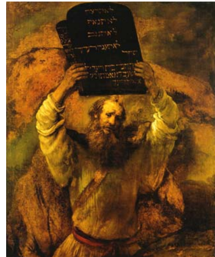
Foto: Mosè rompe le tavole della legge Dipinto di Rembrandt

Tutto questo significa che l'Eterno voleva imprimere nella mente dei Suoi figli l'importanza e la santità del Decalogo, codice morale per tutti gli uomini di tutti i tempi.