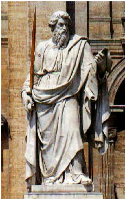
Foto: L'apostolo Paolo

A prima vista, sembra che vi sia contraddizione fra l'affermazione dell'apostolo Paolo in Romani 4:4-5 ("Ora a chi opera, il salario non è messo in conto come grazia, ma come debito; mentre a chi non opera ma crede in Colui che giustifica l'empio, la sua fede è messa in conto come giustizia.") e il discorso di Giacomo al cap. 2: