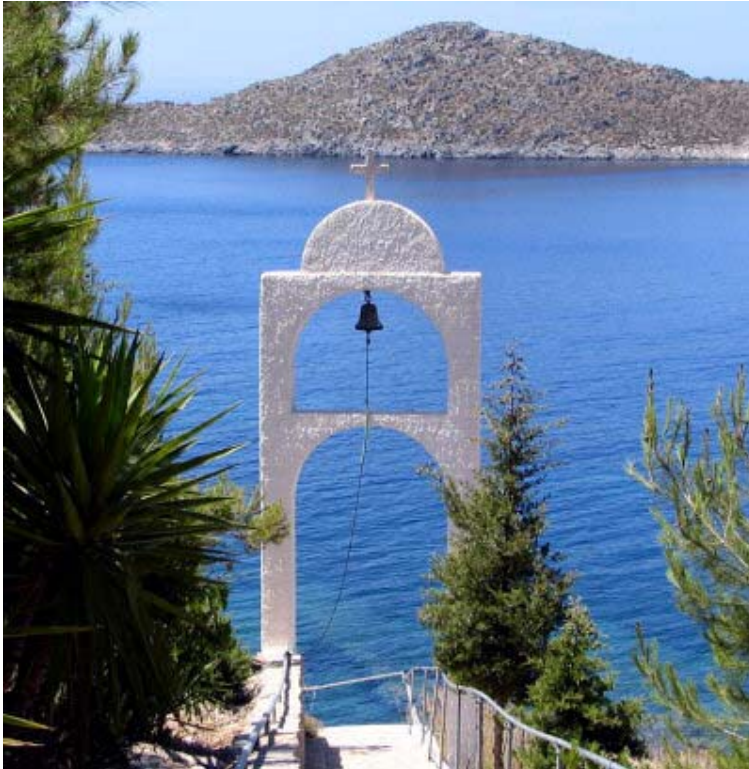
Foto: Isola di Patmos, esilio di Giovanni quando ricevette le visioni dell'Apocalisse

D'altra parte, l'arca vista da Giovanni non può che indicare il Nuovo Patto, dato che la visione gli viene data alla fine del I secolo e riguarda inoltre avvenimenti a lui futuri. L'arca del Santuario terreno era "figura ed ombra" di realtà celesti, secondo che fu detto a Mosè (Ebrei 8:5), come spiega l'apostolo Paolo nella sua epistola agli Ebrei. Dunque, se Dio mostrò a Giovanni l'arca del patto fu quindi per sottolineare il fatto che è sempre la stessa legge morale a regolare la vita del cristiano. Infatti, non è pensabile che il simbolo dell'arca fosse inteso come vuoto del suo contenuto, cioè della legge, perché l'arca da sola non aveva e non ha nessun significato.