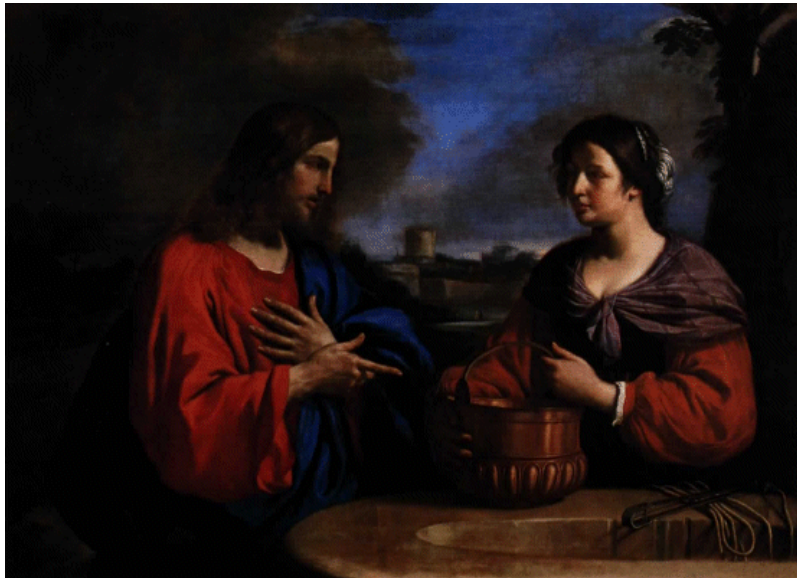
Foto: La Samaritana al pozzo – Dipinto di Giovan Francesco Barbieri, detto il Guercino (1591-1666)

Naturalmente, non possiamo permetterci di giudicare chi ci circonda o che frequentiamo: ha fatto definitivamente tacere dentro di sé quell'anelito spirituale o ce l'ha in stato di "paralisi" momentanea? Noi non possiamo saperlo. Quando l'Eterno ci chiede di essere Suoi testimoni, non ci chiede nient'altro che di prestargli la nostra collaborazione per far risorgere, per far affiorare quest'anelito vitale dal fondo dell'inconscio di qualcuno, in modo che quella persona si convinca di qual è il vero suo bisogno, la vera sua sete... nascosta e camuffata da tutta una serie di soddisfazioni materiali, di idoli vuoti.