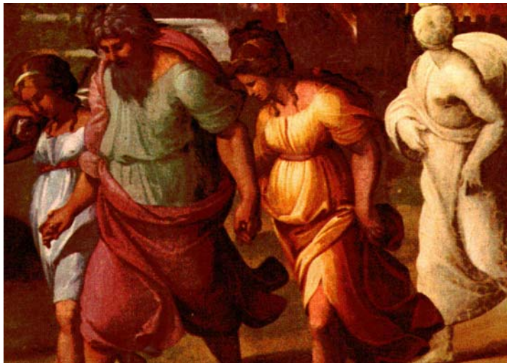
Foto: Fuga di Lot da Sodoma - Raffaello

MALVAGITÀ IN AUMENTO → Luca 17:26-30// Timoteo 3:1-5/Matteo 24:12 (cfr. Matteo 24:37-39)