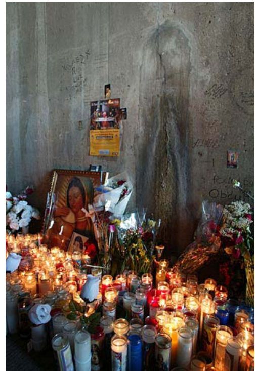
Foto: Una macchia di umidità comparsa in un tunnel viene scambiata per una apparizione della Madonna e scatena la superstizione popolare

L'uomo del nostro tempo sente, sempre di più, di dipendere da se stesso, di essere creatore e giudice della propria moralità.» (G. Leonardi, "Il ritorno annunciato" - pp. 49-50)