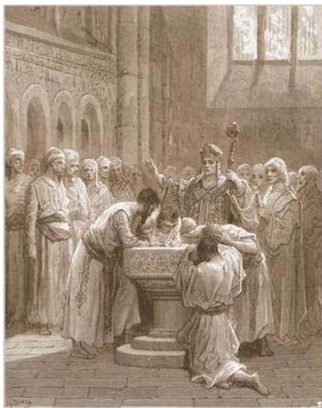
Foto: Incisione di Gustav Doré