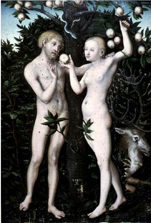
Foto: Adamo ed Eva (1538) - Lucas Cranach il Maggiore - Tavola a olio

Creando anche la donna ad immagine di Dio, come completamento dell'uomo, "aiuto che gli fosse convenevole", l'Eterno stabiliva le condizioni necessarie per la felicità della coppia, base indispensabile per una sessualità che sviluppava armonia e unità , diventare "una sola carne" (Genesi 2:24).