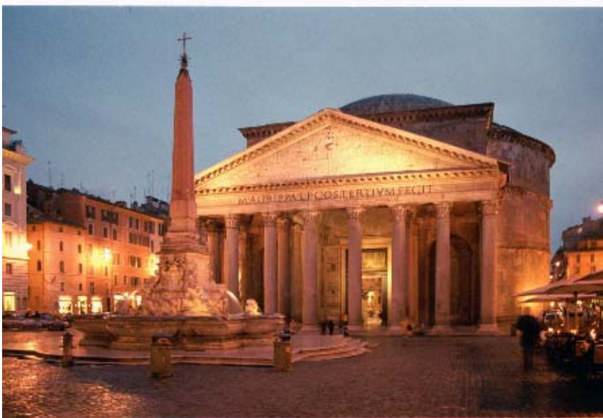
Foto: Il Pantheon di Roma

Abbreviazioni delle varie traduzioni della Bibbia: L = Riveduta Luzzi BG = Bibbia di Gerusalemme ND = La Nuova Diodati NR = La Nuova Riveduta TILC = Traduzione Interconfessionale in Lingua Corrente