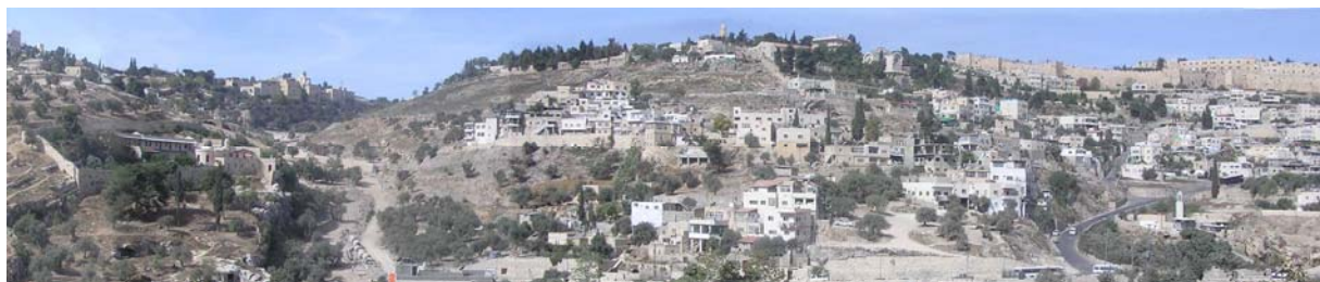
Foto: Veduta sul Monte Sion

Pietro stesso, il presunto privilegiato, non riconosce altra autorità che quella di Cristo ed indica in Lui la Pietra Angolare su cui è fondata la Chiesa.