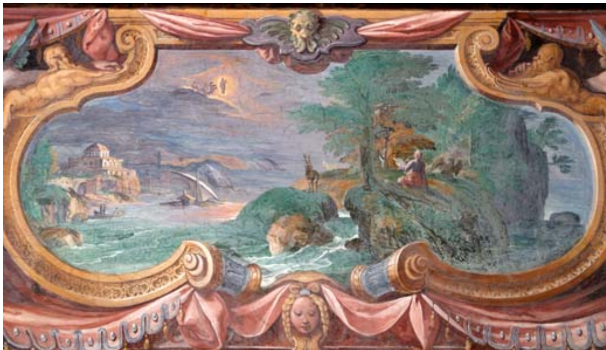
Foto: Visione apocalittica di Giovanni a Patmos (Apocalisse 12) - Vaticano

(La precedente Versione Luzzi traduce "nel giorno di domenica" e riporta una nota in calce, che precisa: "Il greco ha: nel giorno del Signore")