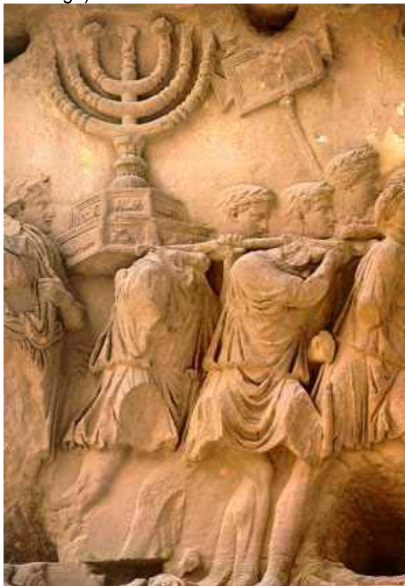
Foto: Bassorilievo nell'arco di Tito, a Roma, che ricorda la distruzione di Gerusalemme nel 70 d.C.

essere venuto per abolire la legge, bensì per compierla (Matteo 5:17-19 → il contesto cita precetti del Decalogo).