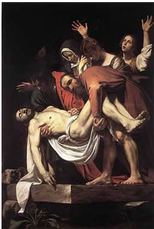
Foto: Deposizione dalla croce – Caravaggio (1602-1604)

Infatti, i soldati romani venuti per spezzargli le ossa ed affrettarne la morte, perché stava per cominciare il sabato, lo trovarono già morto e non lo toccarono, salvo forargli il costato con una lancia per assicurarsi dell'avvenuta morte (cfr. Giovanni 19:36, che cita appunto i due passi sopraindicati).