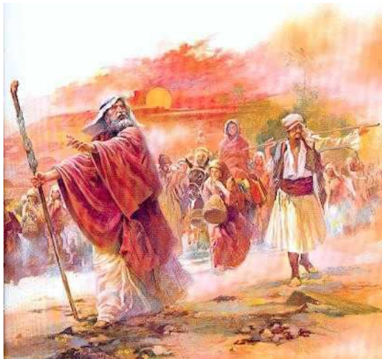
La chiamata di Abramo

Quando Dio chiamò Abramo ad uscire dalla sua terra per andare in un "paese che io ti mostrerò", precisò anche: "In te saranno benedette tutte le famiglie della terra" (Genesi 12:1-3). Questo passo è sempre stato inteso come messianico; infatti, in che modo Abramo e la sua progenie sarebbero stati fonte di benedizione per il mondo intero, se non a causa del Messia promesso che sarebbe nato dalla stirpe del patriarca discendente di Sem, figlio di Noè?